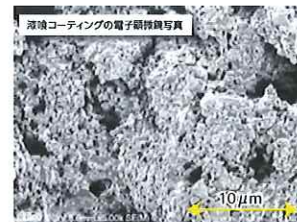
しっくい和紙貼りますCARの表面は、漆喰と同じように消石灰による多数の細孔が存在します。このことで上記のような特徴がもたらされます。

しっくい和紙貼りますCARの表面は電子顕微鏡レベルで観てみると、右の写真のように微細な細孔がたくさん空いています。ここにニオイの元となる分子を物理的に吸着し、消石灰との反応で浄化することでニオイの元が分解され、消臭効果を発揮するので。